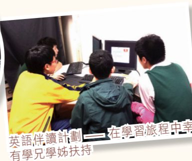
英語伴讀計劃—— 在學習旅程中幸有學兄學姊扶持