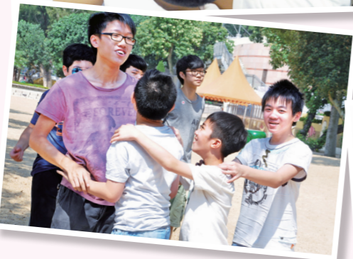
「大哥哥大姐姐計劃」—— 學兄學姊與中一同學在成長路上同行