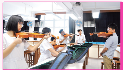
學校為同學提供十多類樂器課程，圖為中一級同學上課情形。