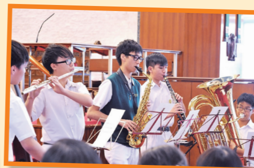
學校在體藝方面發展蓬勃，「一人一樂器計劃」為大家培養終身的興趣，圖為管弦樂團成員為新同學及其家長展示學習成果。