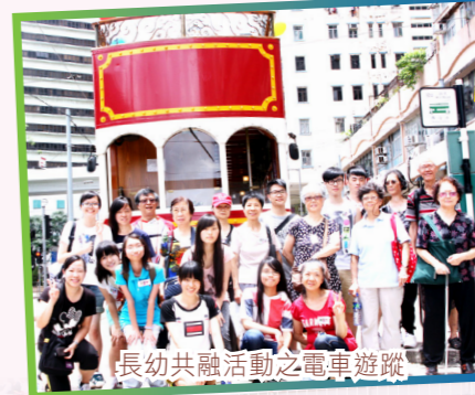
長幼共融活動之電車遊蹤