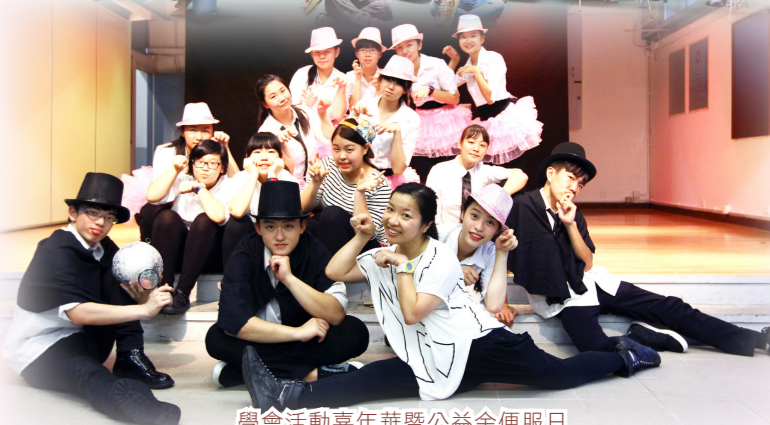
學會活動嘉年華暨公益金便服日