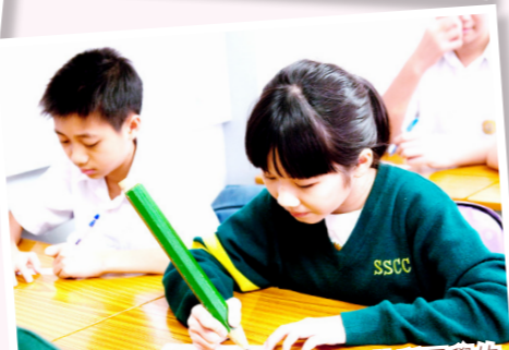
「共融工作坊」—— 認識不同特質同學的需要，和諧共處，砥礪互勉。