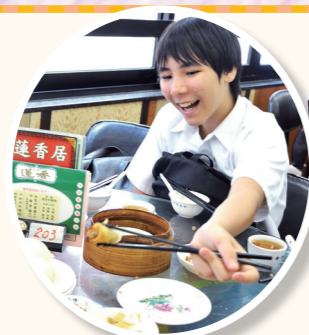
中華文化體驗活動—— 從應用實踐中學習中國文化，融入生活中。

本校著重提升同學的學業水平，因應他們在不同學習領域的根基及能力，因材施教；並調配各種資源，為同學創造最有利的學習條件，給他們提供最適切的學習環境及機會，讓他們學有所成，貢獻社會。