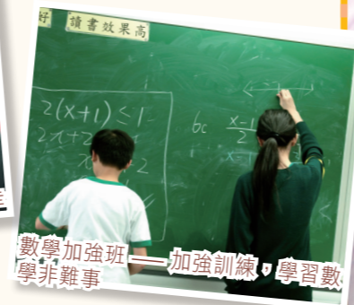
數學加強班—— 加強訓練，學習數學非難事