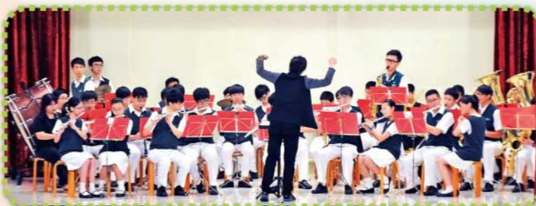
樂器班導師的參與，令演出既專業而又溫馨。

在匯演中，我看到同學們一起努力的成果。雖然合唱團的訓練使大家十分辛苦，但在獲得全場掌聲的一刻，我十分感動和興奮。在過去一年與同學們一起成長的學習歷程中，我不僅學到許多知識，更感受到家的溫馨。