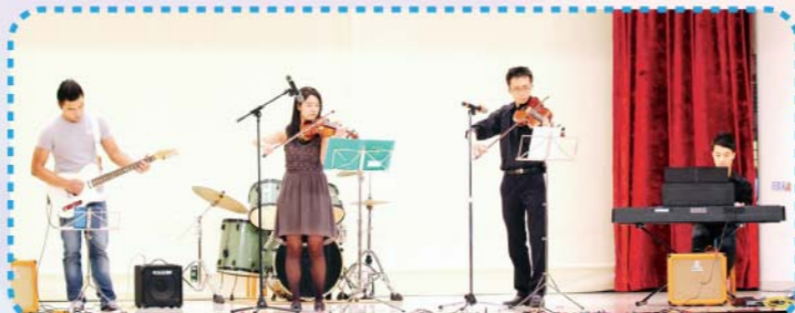
▲四位音樂造詣精湛的不同級別校友，因著音樂及母校的關係，同台演出，為母校慶賀生辰。