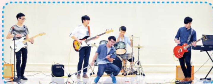
▲由校友與同學組成的Departure樂隊的組合及演出讓大家耳目一新