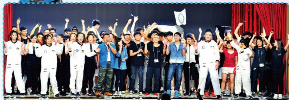
▲校慶匯演在歡樂與激情中圓滿結束