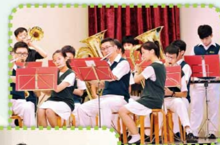
管樂隊奏出節奏強勁的Gangnam Style，加上「江南十兄弟」鬼馬詼諧的舞姿，把現場氣氛推到高峰。