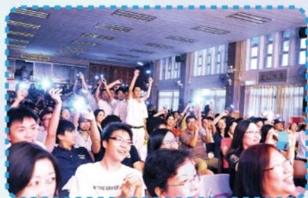
▲樂隊的精彩演出，令現場氣氛澎湃。

「團結，守望相助」是SSCC的不滅精神，這個地方成就了今天的我，謝謝SSCC師長的教誨！