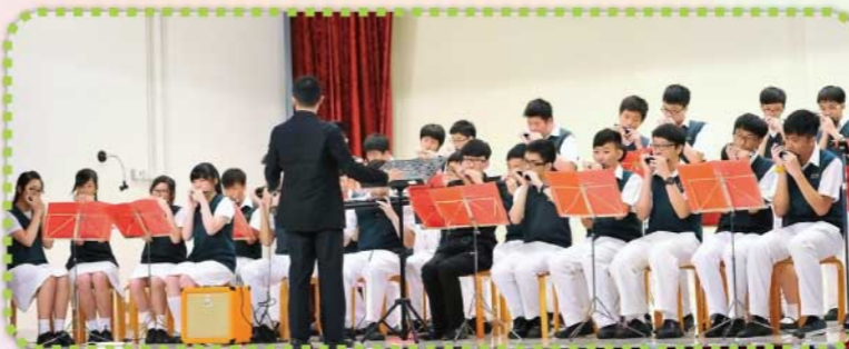
口琴隊成立只有兩年，能夠參與這次校慶匯演，隊員們都十分興奮。