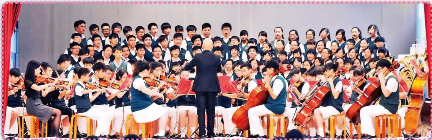
合唱團跟管弦樂團攜手演出「仙樂飄飄處處聞」選段，揭開序幕。在開場時，白幕落下的一刻，非常震撼！

校慶匯演真是非常精彩！同學們表現出超乎其年齡的能力，演出極其專業及出色，高素質的表演讓我們融入其中。師生間的合作及忘我演出，充分反映彼此的深厚感情，並觸動我們校友的回憶。感動，欣慰！